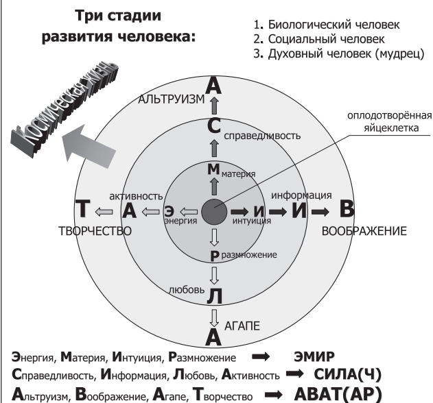
Рис. 1. Динамика взаимоперехода трёх стадий развития человека

Для облегчения обсуждения определим эту стадию развития человека как СИЛА. И в этом случае коннотации очевидны и продуктивны.