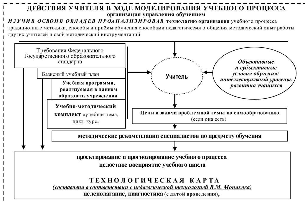
Рис. 1. Алгоритм