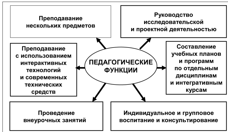
Рис. 1. Педагогические функции в современных образовательных моделях