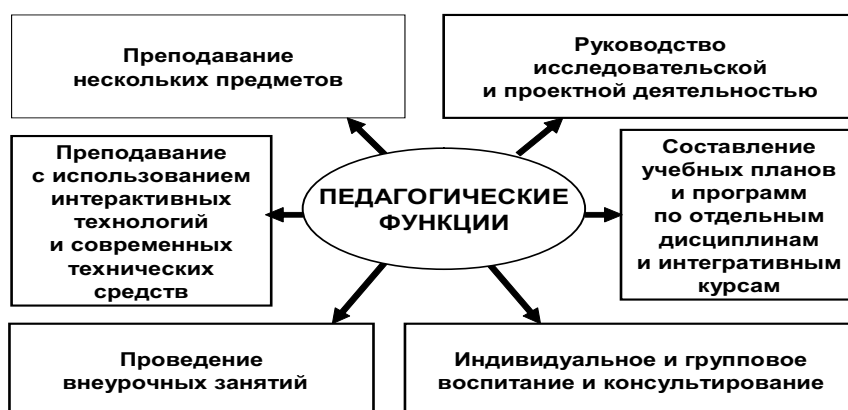
Рис. 1. Педагогические функции в современных образовательных моделях

Педагоги должны быть солидарны в своих взглядах на смыслы и цели образования. Функционал педагогов включает преподавание нескольких предметов, руководство проектной деятельностью, индивидуальную и групповую воспитательную работу, а также внеурочные занятия и консультирование школьников (рис. 1.). Таким образом, каждый педагог в равной мере выступает в роли учителя-предметника и наставника-воспитателя.