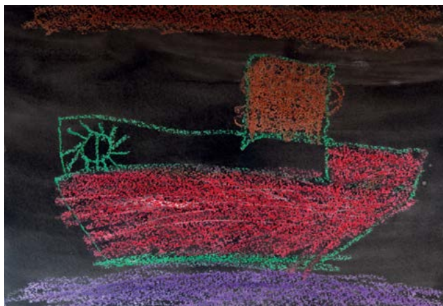
Картина 1. «И НАСТУПАЕТ НОЧЬ»

Восковые мелки. Они не очень яркие. На них надо сильно нажимать, чтобы остался заметный след.