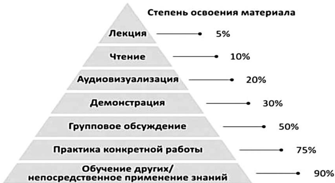
Рис. 2. Степень освоения материала

Практика — старейший способ обучения. Идея проста и понятна: человек осваивает профессиональные навыки и инструменты, включаясь в реальную деятельность. Этот подход использовался как при обучении охоте или земледелию в древние времена, так и в ремесленных мастерских в Средние века. В современной системе образования практика широко применяется еще и при организации стажировок и практик учащихся — производственная, учебная, педагогическая, преддипломная.