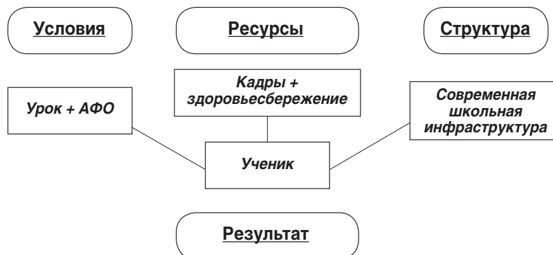
Схема 2. Модель типового школьного кластера

На основании типовой модели может быть сформирована модель для кластера внутри самой школы (схема 2).