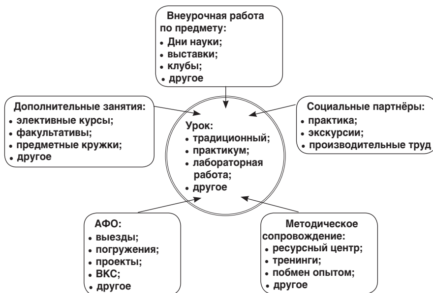
Схема 4. Внутришкольный кластер второго порядка (предметный)

Самым ресурсоёмким по характеру взаимосвязей можно считать внутришкольный кластер второго порядка (предметный) (схема 4).