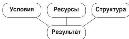
Схема 1. Модель типового кластера

Разнообразие этих занятий порождает рассогласованность при взаимодействии друг с другом участников образовательного процесса: она проявляется при наборе детей в различные группы, составлении расписания, определении тематики занятий. Мы использовали кластерный механизм преодоления рассогласованности. В каждом предметном кластере есть педагогические партнёры — это школы-соседи, детские сады, вузы, библиотеки, музеи и т.д. Понятие кластерного подхода соответствует основным требованиям к инновационной образовательной программе: требованиям к структуре, условиям и результату. Такие направления, как обновление образовательных стандартов, поддержка талантливых детей, развитие учительского потенциала, формирование школьной инфраструктуры, государственно-общественное управление, здоровьесбережение соответствуют структуре типового кластера (схема 1).