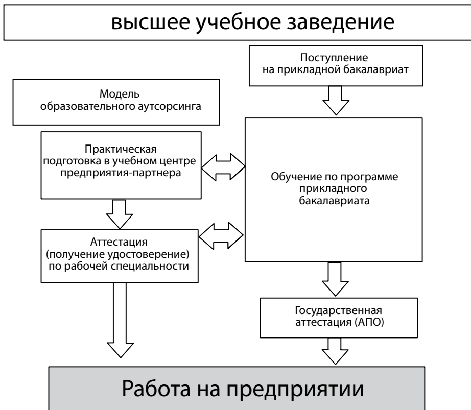
Рис. 1. Организационная модель образовательного аутсорсинга при реализации прикладного бакалавриата

Вторая модель — это создание образовательной инфраструктуры на основе горизонтальной кооперации между автономными учреждениями профессионального образования и отраслевыми предприятиями. Субъекты инфраструктуры создаются как на базе учреждения профессионального образования, так и на базе отраслевого предприятия. К ним относят: отдельные рабочие места; мастерские, лаборатории, филиалы,