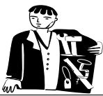
Таблица 3. Изучение словарных слов в 4 классе