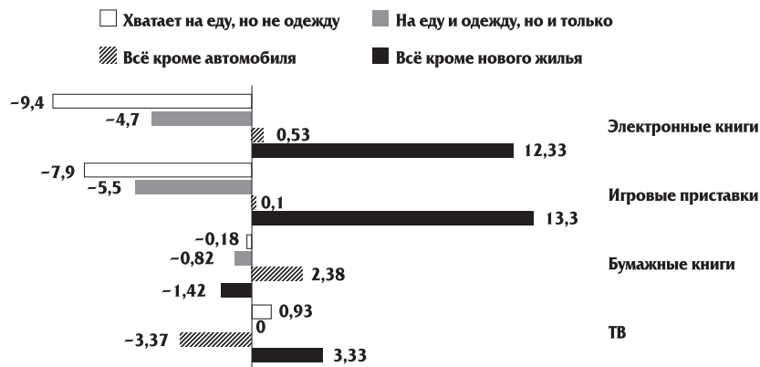
Рис. 5. Чем занимаются вместе с детьми в семьях разного достатка, отклонение от среднего %. Digital Parenting, 2013

Поиск в Интернете — самая распространённая совместная деятельность родителей и детей старшего школьного возраста.