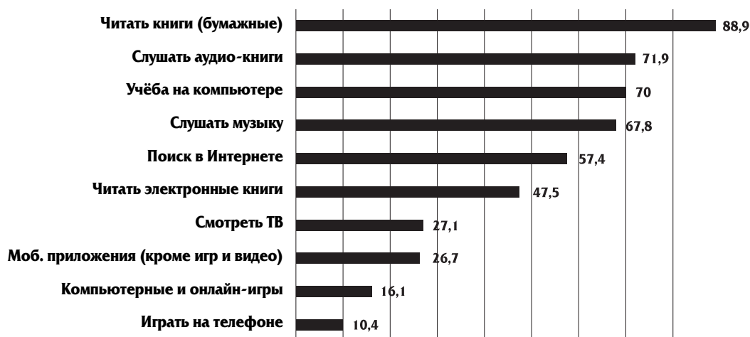
Рис. 2. Польза разных медиа (по мнению родителей), %. Digital Parenting Russia, 2012