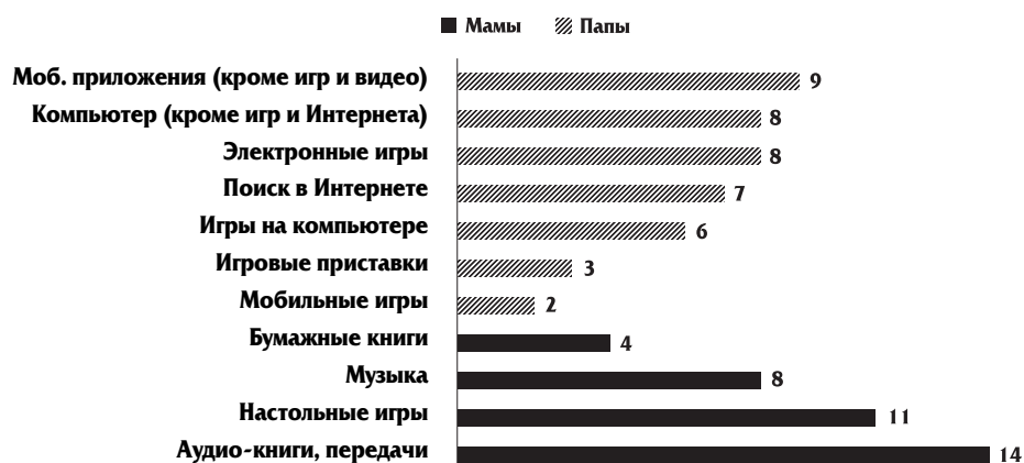
Рис. 4. Что оказывает положительное влияние на детское развитие — разница во взглядах пап и мам, %. Digital Parenting, 2013

После третьего класса традиционные медиа (ТВ, бумажные книги и т.д.) быстро теряют свою популярность как способ совместного времяпровождения с родителями. На их место приходят электронные книги, мобильные приложения и поиск в Интернете.