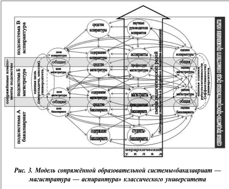
Рис. 3. Модель сопряжённой образовательной системы «бакалавриат — магистратура — аспирантура» классического университета

бующих свои силы или зарабатывающих своё преподавательское мастерство. Таким образом, магистрант-практикант — это двойная роль , сопрягающая подсистемы бакалавриата и магистратуры. Преподаватель бакалавриата тоже может быть в двойной сопрягающей роли — преподавателя для бакалавриантов и преподавателя-методиста для магистрантов-практикантов.