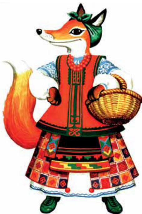
Рисунок с сайта: www.budschool.at.ua

ная цель – знакомство с буквами. Основная цель та, что дети здесь разговаривают . Здесь с ребёнка снимаются все зашоренности: что буквы – это, мол, страшно, что буквы надо учить. Здесь идёт разговор о жизни, о жизни «Аквариума», где в одном углу – одно, в другом другое, можно поговорить о том, что произойдёт, если убрать этот фильтр, и т.д. Идёт познание мира и отражение своего внутреннего понимания окружающего мира через этот «Аквариум».