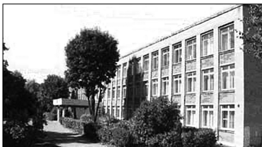
Большевяземская гимназия Одинцов- ского района Москов- ской области

Во время прохождения педагогической практики в феврале — марте 2012 года на базе Большевяземской гимназии Одинцовского района Московской области студентами-практикантами филологического факультета Одинцовского гуманитарного института был разработан творческий проект «My friends are my pets» для учащихся начальной школы. Данный творческий проект завершал пройденную тему «My pets» по УМК И.Н. Верещагиной, Т.А. Притыкиной «English». Тема проекта соответствовала потребностям и интересам данной группы учащихся, отвечала возрастным особенностям, что оправдывало усилия всех учащихся.