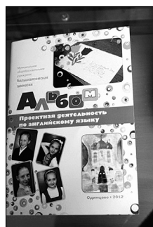
Обложка альбома по проектной деятельности учащихся