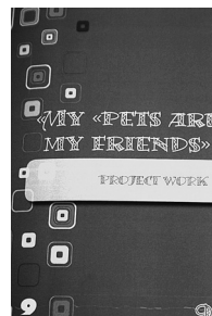
Продукт проектной деятельности — альбом