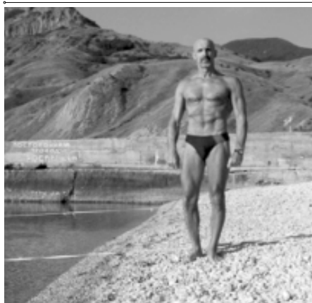
Автор на 60-м году

Но первые считают себя лучше, совершенней, а вторые, понимая, в глубине души, что идеал недостижим, всё же бесплодно мечтают и страдают комплексом неполноценности. Очевидно, что бодибилдинг не путь к красоте, здоровью и гармонии.