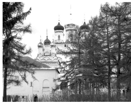
Внутри монастырских стен. Успенский собор

Первую церковь на его месте — деревянную, одноглавую — выстроил сам Иосиф Волоцкий в 1479 году. Пять лет спустя здесь уже красовался новый белокаменный собор, что говорит