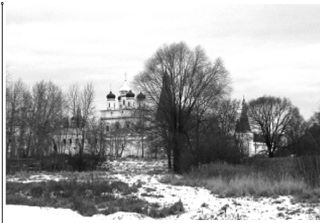
Вид монастыря с юго-запада

ской жизни постройки вписывались в архитектурный ансамбль очень ненавязчиво, деликатно, не повреждая устоявшуюся гармонию. Никто, по счастью, не додумался перестраивать старинные храмы сообразно «вкусам времени». Четырёхсотлетняя красота не потревожена ни вычурным барокко, ни сухим тяжеловесным классицизмом, ни беспардонным псевдорусским стилем с его вездесущим красным кирпичом и попытками вымучить что-то более совершенное, чем точеные формы древних крестово-купольных храмов... Нет, не поймите неправильно — каждый стиль уникален, каждый рождает свои шедевры. Но из полотен Левицкого, Репина и Петрова-Водкина не получится триптих. Что очевидно в других отраслях искусства, почему-то часто напрочь забывается в архитектуре: в одну телегу впрячь не можно коня и трепетную лань. Идея бездумно «втыкать» в ансамбль неподходящую ему постройку родилась ведь не при проектировании «Москва-