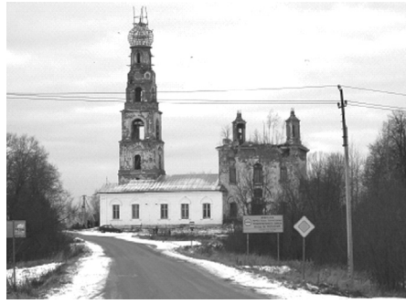
Вознесенская церковь в Теряеве

В куда худшем состоянии — некогда пятиглавая Вознесенская церковь на монастырском подворье в самом селе Теряеве. Храм представляет ужасающее зрелище разрушения — особенно после того, как несколько лет назад обрушился центральный купол. Ремонт трапезной и основания колокольни не в силах скрасить картину — церковь, после десятилетий запустения и использования под гараж, по-прежнему выглядит обречённой, ожидая