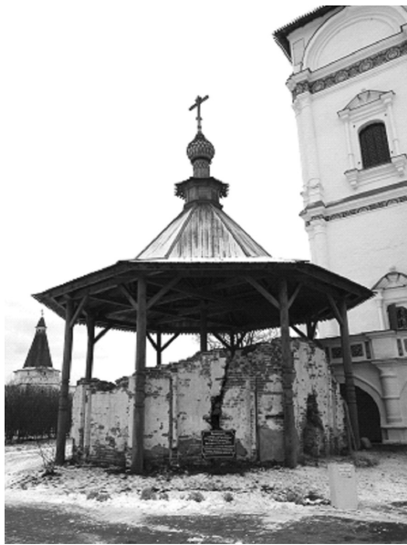
Сень над основанием колокольни