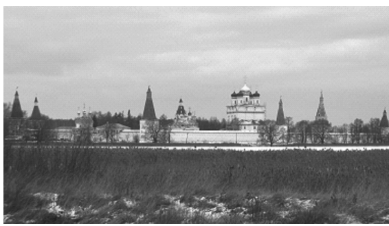
Вид Иосифо-Волоцкого монастыря

Уже неведомо, какая драма разыгралась в селе, получившем впоследствии название Теряево, но в просторах земли Старого Во-