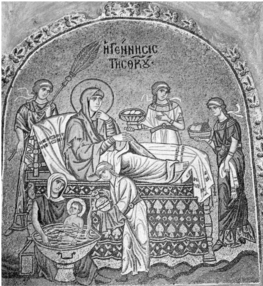
Рождество Богоматери. Мозаика церкви монастыря Дафни, Греция. Рубеж XI–XII веков

городицу в Иерусалим, в Святая Святых 21 ; 3 года было Богородице, и представили её перед Господом с дарами 22 . И принял её, и с дарами, священник Варахия, отец Захарии 23 . И все священники радовались, и помолились, и благословили их: Иоакима, и Анну, и дитя Марию; и ушли они в Назарет.