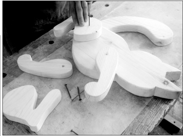
Прикрутить к туловищу лапы.