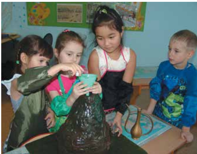
Высыпаем в жерло смесь

Вот и для получения нашей лавы мы смешиваем порошок соды и лимонной кислоты, в сухом виде, приблизительно в соотношении 5:4. Жерло вулкана до извержения тоже должно быть сухим. Маленькой ложечкой (от игрушечной посуды) или через тонкую воронку мы осторожно засыпаем через кратер готовую смесь порошков в жерло и аккуратно утрамбовываем её спицей, зубочисткой или спичкой.