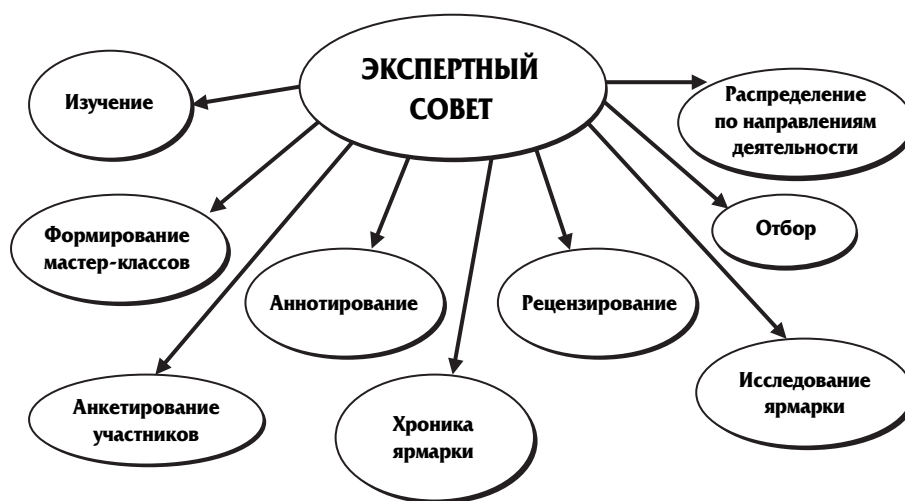
Схема 2. Функции экспертного совета

Кроме того, ежегодно отмечаются несколько десятков проектов, не участвующих в ярмарке, но имеющих ценные идеи. Их авторам рекомендуется доработать проекты и представить в следующем году.