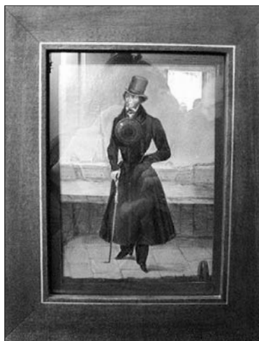
Портрет А.С. Пушкина в Болдинском музее

Кроме того, ребята отметили, что Болдино и сегодня воспринимается как край земли, край света, это заповедные места в полном смысле слова. Прочувствовать это можно, только лишь побывав там. Снова вспомнился буран, застигший нас на пути из Болдина, когда всё замерло вокруг и мы почувствовали себя затерянными во Вселенной... Нетрудно представить себе, каким краем света ощущалось Болдино в 1830 году! Поэтому, наверно, в Болдине и были написаны философские произведения Пушкина.