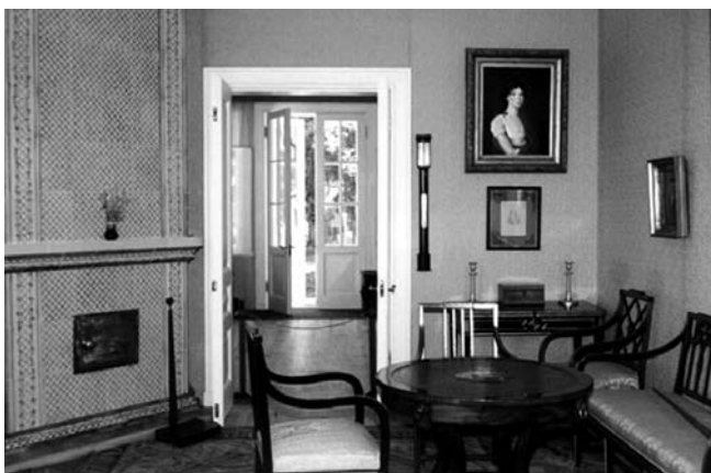
Гостиная в доме-музее А.С. Пушкина в Михайловском

При слове «село» не думайте о церкви и многих домах, которые ютятся около церкви в русских сёлах. В Псковской губернии селом называется просто усадьба или селение».