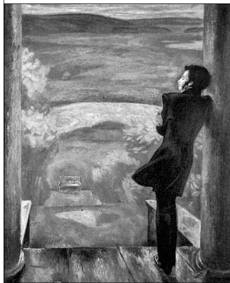
«Осенние дожди» (А.С. Пушкин). В. Попков. 1973

Нас было много на челне; Иные парус напрягали, Другие дружно упирали В глубь мощны вёслы. В тишине На руль склонясь, наш кормщик умный В молчанье правил грузный чёлн; А я — беспечной веры полн, — Пловцам я пел... Вдруг лоно волн Измял с налёту вихрь шумный... Погиб и кормщик и пловец! — Лишь я, таинственный певец, —