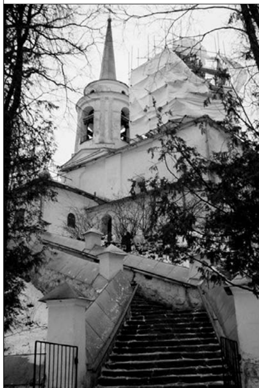
Святогорский мужской монастырь

К могиле Пушкина надо идти через пустынные монастырские дворы и подыматься по выветренной каменной лестнице. Лестница приводит на вершину холма, к обветшалым стенам собора.