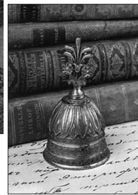
Музей-квартира А.С. Пушкина на набережной Мойки, 12

как заморожённо слушали экскурсовода. Тогда ребята впервые узнали, что в турпоходе не только спят в палатках, готовят пищу на костре, поют песни под гитару, но и узнают много нового не из книг и учебников, а при непосредственном прикосновении к культурным ценностям. Через несколько лет эти ребята снова вернулись в Остафьево. Итогом этих походов стали работы школьников о выдающихся деятелях