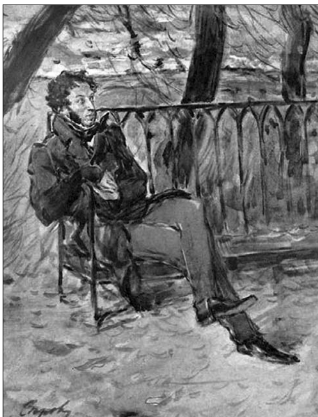
Пушкин в парке Михайловского. В. Серов. 1899

дала его таким добродушно весёлым и любезным.