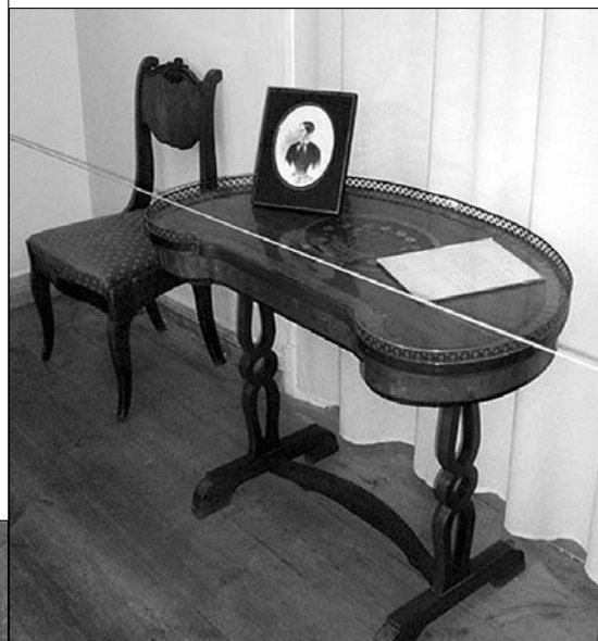
Столик-боб в музее А.С. Пушкина в Болдино

В завершение урока старшеклассникам был задан итоговый вопрос: «Что дали вам путешествия по пушкинским местам России?»