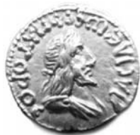
Старинные монеты Боспорского царства