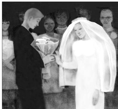
Т. Яблонская. Обручальное кольцо

(которые, в свою очередь, делились на грудных и просто младенцев); детей младшего, среднего и старшего возраста (приблизительно трёх-пяти, пяти-восьми и восьми-десяти лет), в зависимости от того, какую именно помощь в отличие от младенцев они могли оказывать родителям по хозяйству; подростков десяти-пятнадцати лет, которые в отличие от детей не просто помогали по хозяйству, а являлись своего рода «заместителями» отца и матери семейства по ряду важных трудовых операций и по уходу за младшими братьями и сёстрами; наконец, молодёжь пятнадцати-двадцати лет, оставшуюся на положении подростков в ожидании скорой свадьбы и в случае отсутствия таковой переходившую в обязательном порядке на третьем