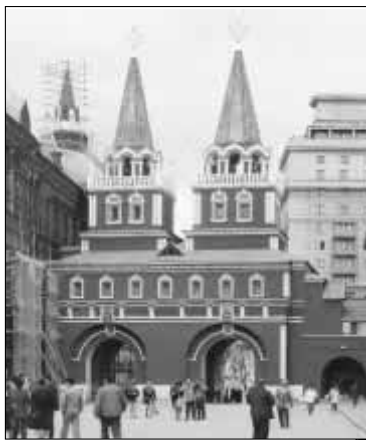
Восстановленные Воскресенские триумфальные ворота. 1997 г.

Не будем однако забывать и о том хорошем, что было в девяностые годы, когда сбывались наши мечты о восстановлении утраченных в XX веке храмов, памятников, утраченной исторической памяти. В эти годы к нам вернулись мыслители, без которых нельзя представить себе современной российской культуры и школы: И.А. Ильин, В.В. Розанов, Н.А. Бердяев, вернулись «репрессированные» произведения Н.В. Гоголя, Б.Л. Пастернака, многих других русских писателей и учёных. В 90-е годы наша наука прирастала возвращёнными именами — и мы получили невиданное богатство, которое в той или иной, редуцированной или дополненной форме навечно останется нашим всенародным достоянием. 90-е годы были не только временем утрат, но и временем обретений — пусть и не осмысленных нами. Авторы этих строк много лет мечтали о том времени, когда к Историческому музею на Красную площадь Москвы вернутся Воскресенские ворота с Иверской часовней. Святое место, символ матушки-Москвы. Не забыть тех чувств, которые мы ис-