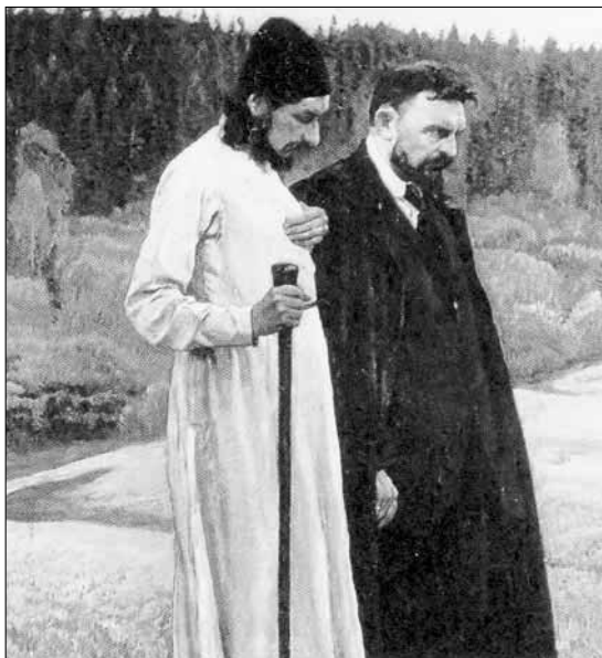
«Философы». Худ. М. Нестеров, 1917 г.