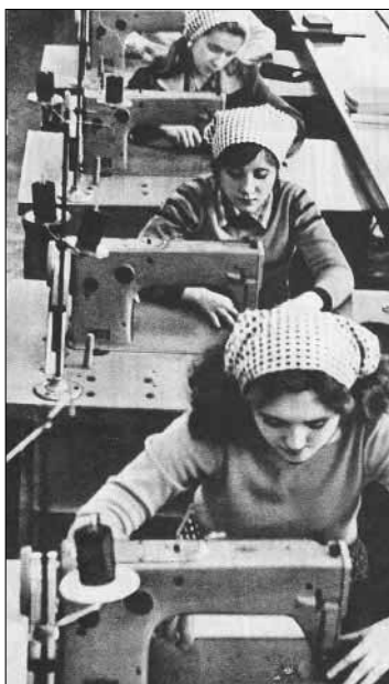
В учебно-производственных комбинатах школьники получали профессию

Тогда же были введены в действие переработанные типовые программы трудового обучения в 1–4-х и 5–7-х классах. К 1987–88 учебному году были разработаны программы профессионального обучения: в 8–9-х классах по 30 профилям и в 10–11-х классах — по 80. Была также разработана типовая программа курса «Основы производства. Выбор профессии», вводимого в 8–9-х классах. Существенной переработке подверглись нормативные документы: положение о базовом предприятии школы, о трудовых объединениях школьников, об учебно-производственном комбинате. Созданы новые положения, например, о школьном кабинете профориентации, об учебно-опытном участке, об организации трудового обучения и общественно полезного труда школьников на базе средних профтехучилищ. Стало ли всё это школьной практикой? Признаемся честно: большинство школ отделалось видимостью работы. На реальной жизни советских школьников 80-х годов трудовое обучение почти не отразилось. Может быть, причина провала реформы в том, что, по сути дела, на её реализацию школам было дано три учебных года — 1985–1988-е. А уже в 1989-м командно-административная система утратила силу своих рычагов, горбачёвская перестройка смешала все карты, и за реализацию реформы 1984 года, по существу, никто уже не отвечал. Кроме того, годы «перестройки» расставили новые акценты — и те явления школьной жизни, которые в 1984 году казались основными, стали восприниматься как второстепенные.