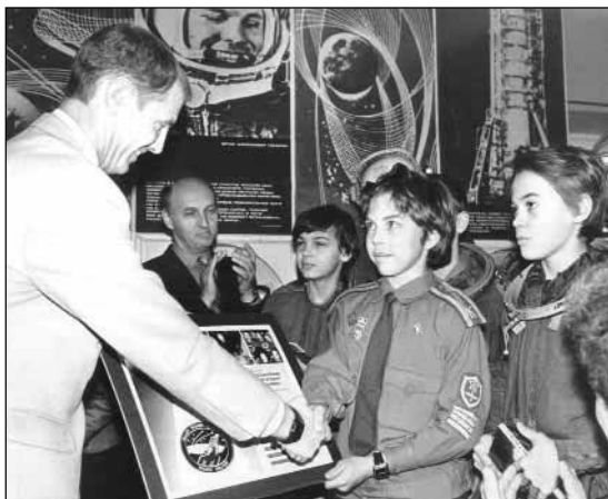
В 1970-е годы день космонавтики стал всенародным праздником