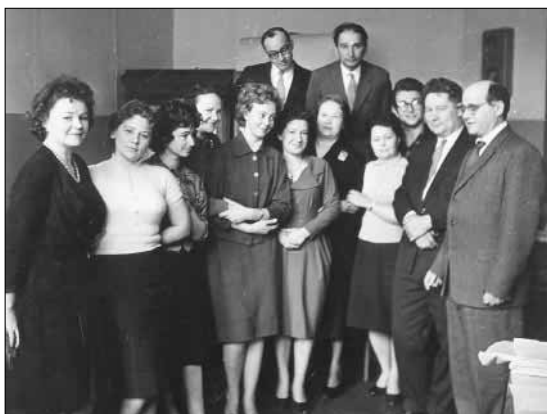
Редакция журнала в 1970-е годы

С 1946 года Щербицкий работал в Днепродзержинске — родном городе будущего главы государства, Л.И. Брежнева. Образованный инженер, фронтовик, пришедший на партийную работу, был важной фигурой для любого крупного завода. Щербицкий становится секретарём партбюро коксохимического завода, оставаясь и инженером. Позже Владимир Васильевич сосредоточивается на партийной работе, став парторгом ЦК КПСС на Металлургическом заводе имени Ф.Э. Дзержинского. В 1952 году Щербицкого назначают Первым секретарём Днепродзержинского горкома партии, в 1954-м — Вторым секретарём Днепропетровского обкома КПУ. Вскоре В.В. Щербицкий входит в политическую элиту страны, став Первым секретарём Днепропетровского обкома — руководителем одной из наиболее промышленно развитых областей СССР. В 1957 году Щербицкий переезжает в Киев, его назначают секретарём ЦК Компартии Украины. Дальше — больше: в 1961 году он почти одновременно становится Председателем Совета Министров Украинской ССР, членом ЦК КПСС и кандидатом в члены Политбюро ЦК КПСС. Последний статус обеспечивал Щербицкому участие в принятии важнейших государственных решений в узком кругу двух десятков вождей.