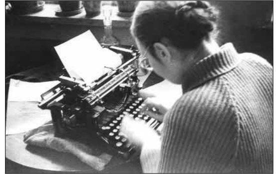
За «Ундервудом». «В забое без сбоя!»