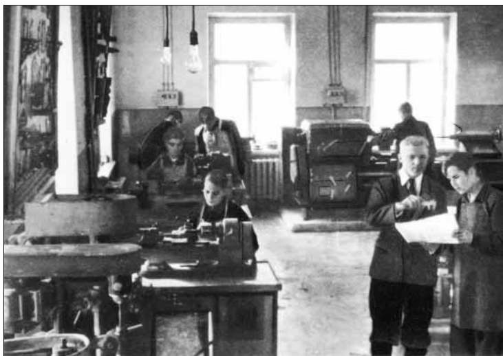
В механической мастерской