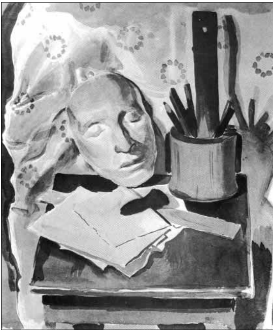
«Натюрморт с маской Пушкина» Худ. В. Фаворский. 1938 г.