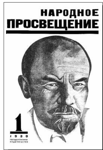
Облик журнала в 20 – 30-е гг. непрерывно менялся. «Народное просвещение» в 1930 году