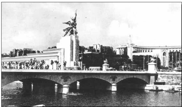
Открытка с Всемирной выставки в Париже в 1937 году. Павильон СССР