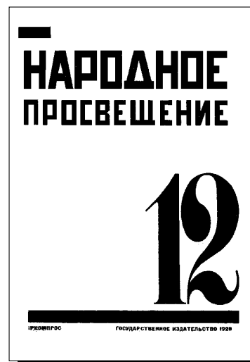
Облик журнала, разработанный А.С. Родченко 1928 г.