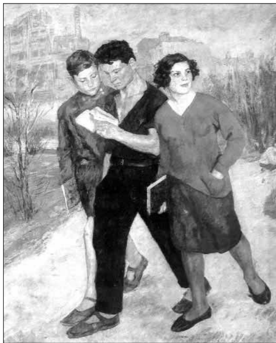
«Рабфак идёт». Худ. Б. Иогансон