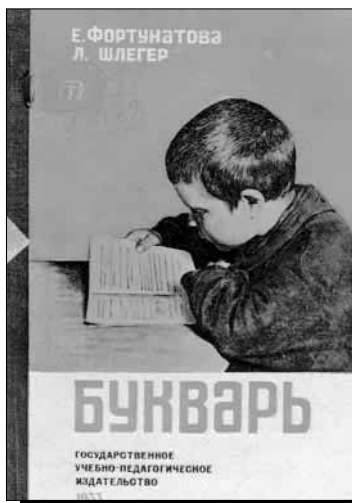
Букварь Учпедгиз 1933 г.