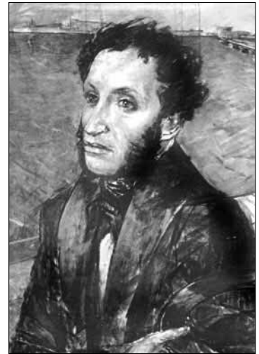
«Пушкин в Петербурге» Худ. К. Петров-Водкин. 1938 г.

Советская школа после реформ 30-х годов давала знания о мире и человеке с марксистских позиций. Ведущую роль идеологических предметов играли общественные науки. На повышение интеллектуального уровня учащихся, на подготовку будущих студентов и учёных, квалифицированных