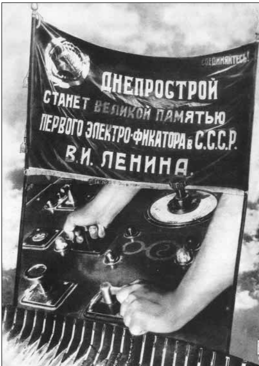
Фотомонтаж для специального выпуска журнала «СССР на стройке», посвящённого строительству Днепрогэс. Худ. Эль Лисицкий. 1932 г.