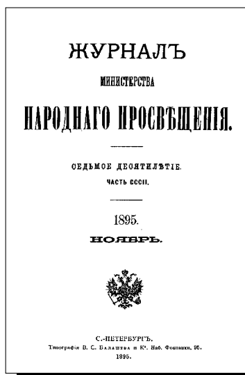
Титул журнала 1895 года

...Любопытен взгляд Пирогова на чувство любви. Любовь, по своей сущности, говорит Пирогов, есть временное чувство, оно принадлежит только одному возрасту. Природа назначила его для возрождения и обновления. Животные, цветы украшаются, для чего-то сходного с нашей любовью, только на время. Какой же прочности можно требовать от чувства, назначенного для одной переходящей цели? Тебе, говорил Пирогов, обращаясь к невесте, которой он сообщал эти взгляды, не-