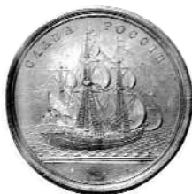
Медаль «Слава России»

И славы гром, Как шум морей, как гул воздушных споров, Из дола в дол, с холма на холм, Из дебри в дебрь, от рода в род Прокатится, пройдёт, Промчится, прозвучит И в вечность возвестит, Кто был Суворов.