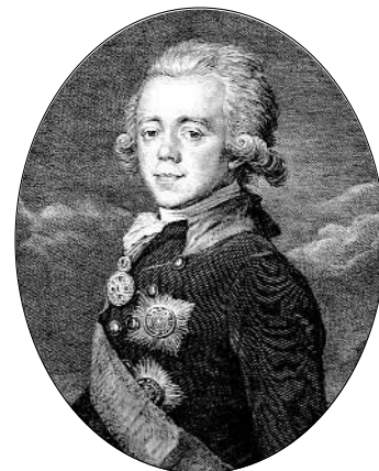
Император Павел I

В Кончанском Суворов разрабатывал план будущей войны с Наполеоном, в которой Россия должна была спасти Европу от французских смутьянов. Но бывали времена, когда помыслы опального фельдмаршала обращались к области, далёкой от политики и военного искусства. Суворов хотел продолжить свои дни в монастыре, просил императора отпустить его в Нилову пустынь 9 ... Однако, серьёзно осмыслив европейскую политику, он понял, что его долг — спасать Россию от надвигающейся с Запада опасности. И, когда Павел предложил Суворову возглавить русско-австрийскую армию, призванную освободить от французов север Италии, Александр Васильевич взял на себя этот крест. Принял, предварительно вынудив Павла разрешить ему — Суворову — вести войну по-суворовски, а не по-пруски. В молчаливом противостоянии кончанский отшельник преодолел упрямство императора стойким терпением и сосредоточенным на славе России, полным смирения умственным трудом. Павел отправил Суворова в Европу «спасать царей». В феврале 1799 года Суворов был восстановлен на русской службе в чине генерал-фельдмаршала, а в марте назначен главнокомандующим союзной армией в Италии. Суворов прибыл в Вену, где огорчил