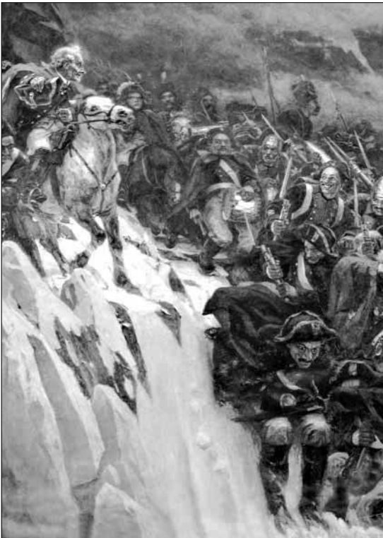
«Переход Суворова через Альпы в 1799 году»

В сентябре Суворов вступил в Швейцарский поход — на помощь генералу А.М. Римскому-Корсакову. В поход, окончательно возвысивший полководца до величавой легенды. Путь его лежал че-