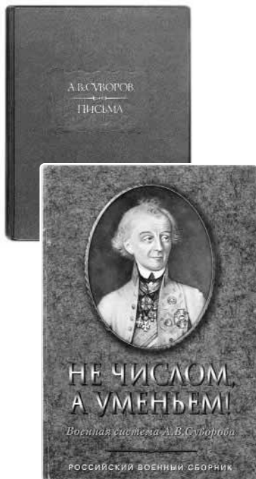
Современные издания об А.В. Суворове