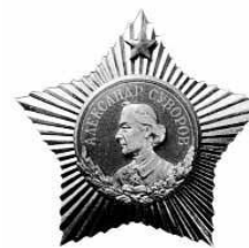
Первым кавалером ордена Суворова 1-й степени стал маршал Г.К. Жуков

Не будем забывать и о публикаторе суворовских архивов в журнале, об одном из самых прославленных сотрудников Министерства народного просвещения и авторов нашего издания за всю его двухсотлетнюю историю. Григорий Петрович Данилевский родился в 1829 году в селе Даниловка под Харьковом в семье богатого малороссийского помещика. Ещё дед писателя прославился на всю округу, да так и остался в истории тем, что занимался искусственным разведением лесов в Харьковской губернии. Отец Григория Петровича умер рано, и будущий романист воспитывался матерью — способной пианисткой, интересовавшейся литературой и искусством. Григорию Данилевскому было двенадцать лет, когда он, уже получив изрядное домашнее образование, был принят в Московский дворянский институт (четвёртая гимназия). Яркое выраженное гуманитарное направление этого учебного заведения, в котором ценились и пестовались таланты, способствовало развитию литературных способностей будущего писателя. Там Данилев-