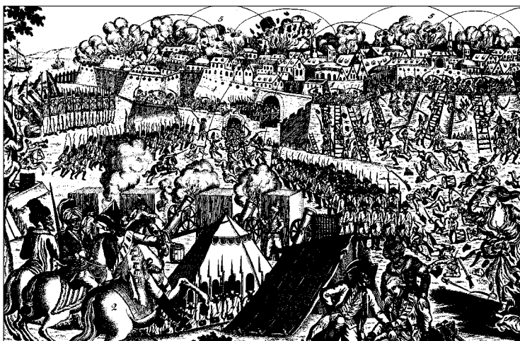
Взятие Измаила 11 декабря 1790 года. И.М. Вилль. Конец XVIII века

По перевязанным лестницам, по штыкам, по плечам друг друга солдаты Суворова под смертельным огнём преодолели стены, открыли ворота крепости — и бой перенёсся на улицы Измаила.