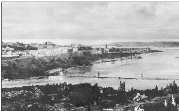
Вид города Севастополя. 1850-е годы

Иначе, чем сердечными и трогательными, не назовёшь отношения Сербиновича с Гоголем.