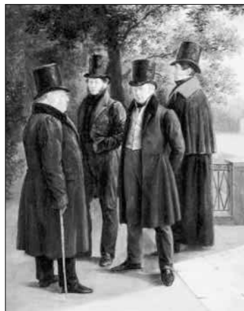
Пушкин, Крылов, Жуковский и Гнедич в Летнем саду. Худ. Г.Г. Чернецов 1832 г.

«Вскоре после трудов и подвигов 12-го года, когда Россия уже наслаждалась плодами славного мира, в Петербурге, под влиянием того направления, которое гений Карамзина произвёл на развитие нашей словесности, молодыми писателями того времени было учреждено ЛИТЕРАТУРНОЕ ОБЩЕСТВО ПОД НАЗВАНИЕМ: АРЗАМАС».