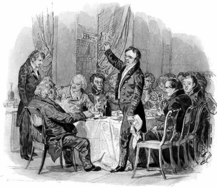
Заседание литературного общества

— Гуси, гуси! Кто вас не любит? Да долго ли вам беситься? Царство литературы почти в ваших руках — когда перестанете вы топить в моих чистых струях карликов Беседы и Академии? Давно уже не стало их бумажных тронов, — перестаньте с ними возиться! Какой чёрт вас с ними связал? Похвально было сказать свету, что они глупцы, похвально было согнать с Парнаса нестерпимую толпу лжегениев; но они давно уже рассеялись под вашими ударами. Чего же вам более? Но должны ли вы довольствоваться сими жалкими трофеями? От вас я ожидаю более; я ожидаю возобновления отечественной литературы, я ожидаю торжества разума и вкуса. Спасайте их, как некогда ваши предки спасали Капитолий: ныне не один Бренн им угрожает; полчища уродливых Бреннов с гасильниками в руках стремятся погасить ту бедную искру человечества и рассудка, которую я поручил в ваше попечение. Пора испугать их светом разума, разогнать их скопища объявлением войны продолжительной и смелой! Тогда я с радостью буду издали внимать кликам вашей победы и с гордостью признавать вас за моих сынов, за истинных Гусей Арзамасских!