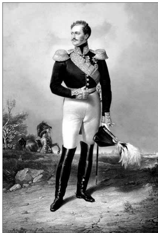
Николай I Худ. Ф. Кригекаль

Внимательный читатель журнала уваровских времён понимает, с каким сосредоточенным вниманием новый министр просвещения отнёсся к государственной идеологии, вне связи с которой он не мыслил просвещения. Сама идеология государства тоже была просветительской, с опорой на культовые фигуры российской имперской истории — великих императоров Петра и Екатерину. Прозорливость Уварова поражает: этот одарённый молодой человек, которого современники считали «бесхарактерным, суетным, легкомысленным», как никто в России того времени, понял богатырскую силу действенной идеологии для государственной жизни, для судеб просвещения. Можно не разделять постулатов Уварова, не всё в них было на пользу России, но следует признать, что в целом это был прорыв. Это была насыщенная, реалистичная и духоподъёмная программа. И сложилась она в воображении Уварова не в одночасье. Может быть, в его сочувствии к консервативным участникам «Бе-