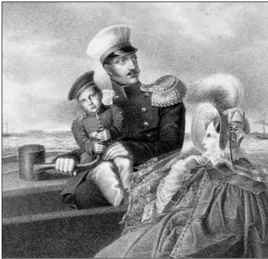
Николай I с супругой Александрой Фёдоровной и цесаревичем Александром

В 1826 году продолжение «Записок» не вышло. Возможно, на это повлияли смена на престоле самодержца и восстание декабристов.