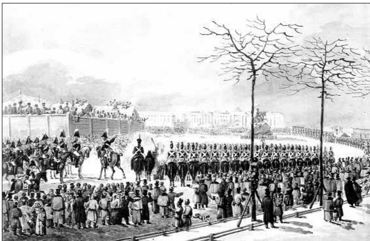
Восстание 14 декабря 1825 года на Сенатской площади в Петербурге Худ. К.И. Кольман

Дубинский повествует: «К Балтийским нашим портам ежегодно приходит из внутренних губерний до 10 000 судов или 75 миллионов пудов груза». А всего в ту пору на внутренних водах действовало было несколько десятков тысяч торговых судов, перевозивших строительный камень, лес-