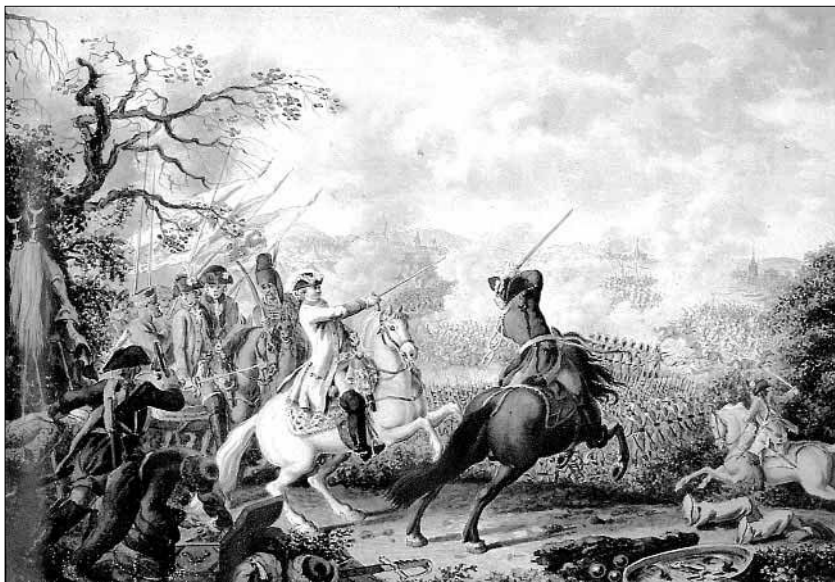
Сражение при Кагуле 21 июня 1770 г. За П.А. Румянцевым, что на белом коне, в треуголке П.В. Завадовский. Худ. Д. Ходовецкий. 1770-е гг.