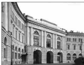
Санкт-Петербург. Министерство народного просвещения. 1828-1834 гг.

Таковы были первые российские министры. А их министерства ждала великая судьба, продолжающаяся и в наше время. Голос Министерства иностранных дел нашей страны уверенно звучал во всём мире в годы правления таких мэтров дипломатического искусства, как «железные канцлеры» Александр Михайлович Горчаков и Андрей Андреевич Громыко. Министерство просвещения (сейчас — Министерство образования) формировало и формирует не только образовательную политику, но и идеологию нашего государства, оказывая решающее влияние на интеллектуальный уровень общества, на его созидательные возможности. И в истории нашего общества были эпохи министров просвещения — Уварова, Толстого, Луначарского, Прокофьева... Эти эпохи пройдут перед читателем этой книги. Вот и сейчас перед Министерством образования стоит задача эквилибристической сложности: нужно на тонкой нити пройти между Сциллой коммерциализации и Харибдой безденежья... Ведь Министерство образования — интеллект государства! А щит и меч его — силовые министерства. Армия всегда была в России государствообразующим началом, военное ведомство возглавляли выдающиеся полководцы и мыслители: Д.А. Милютин, М.В. Фрунзе, Г.К. Жуков. Министерство внутренних дел в наш век международного терроризма и техногенных катастроф оказывается в центре общественного внимания. Кстати, в истории бывали периоды и ситуации, когда руководители этого министерства брали на себя ответственность за политическую жизнь страны, как М.Т. Лорис-Меликов, П.А. Столыпин, Л.П. Берия.