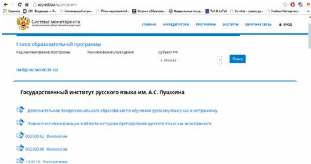
Рис. 2. Автоматизированная информационная система мониторинга результатов профессионально-общественной аккредитации образовательных программ

изучения опыта российских и зарубежных аккредитационных агентств и профессиональных объединений в области инжиниринга при проведении ПОА осуществляет независимую оценку качества образовательных программ.