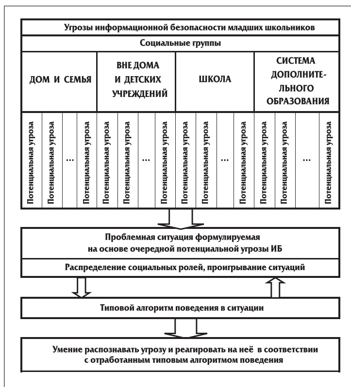
Рис. 2. Модель ситуационного обучения информационной безопасности

Представленная модель подразумевает постановку проблемных ситуаций и их разрешение посредством применения алгоритма поведения в ситуации информационной угрозы. Малых Т.А. в исследовании педаго-