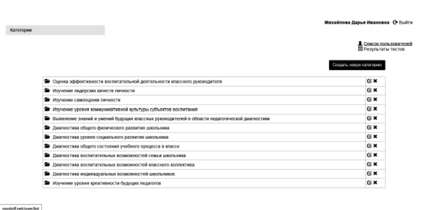
Рис. 1. nordoff.net/ru/en/kit

Программа включает в себя методики и тесты, необходимые для изучения деятельности классного руководителя, воспитанников и всего детского коллектива. Так, методики и тесты распределены в программе