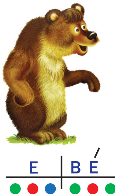
Рис. 2. Звуковой анализ слова

головной убор, у гласных — отсутствует ударение. На уроке, в процессе знакомства со звуками и буквой, их обозначающей, раскрашиваем (иногда дорисовываем) головной убор, сапожки и вклеиваем в тетрадь по чтению. К концу обучения грамоте у детей в тетрадях по чтению накапливается ряд всех звуков русского языка. При выполнении звуко-буквенного анализа слова ребёнок всегда имеет возможность вспомнить изученные звуки, их характеристики, рассмотреть звуковичка, который всегда под рукой. Звуковой анализ слов проводим точно так же, с опорой на звуковички, мы не рисуем треугольники, слоги-слияния, а просто ставим точки разного цвета под буквами.