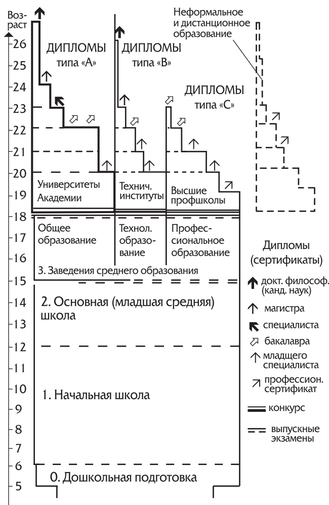
Структура современного первичного образования (Initial Education - 2010)