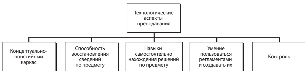
▲ Рис. 1. Структура задач

В данном случае показана общая структура КПК. При решении конкретных задач она может не включать какие-то компоненты, либо разделы решения задач могут быть