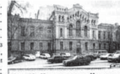
Ил. 159. Императорское Коммерческое училище. Ул. Ломоносова, д. 9

Разночинцы (выходцы из семей разных чинов) могли обучаться в гимназиях, число которых значительно увеличилось. Возросло количество частных гимназий.