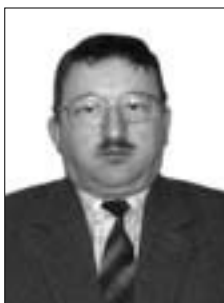
Алексей Герасимов, начальник Департамента образования и науки администрации Костромской области