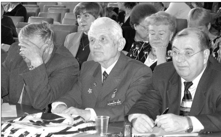
В зале заседаний Третьего Международного конкурса

объединение «Концерн «Пикъ» — поставили перед собой цель, ставшую теперь тоже традиционной: собрать вместе образовательные учреждения России и ближнего зарубежья, которые творчески восприняли идеи А.С. Макаренко и сделали производственный труд основой воспитания школьников. Собрали, чтобы педагоги могли обменяться опытом и воспитательной, и экономической деятельности: продуктивные школы не выживают, не жалуются на скудное бюджетное финансирование, а зарабатывают деньги, живут полнокровной жизнью, удовлетворяя не только учебно-материальные потребности своих учреждений, но и духовные потребности ребят и учителей.