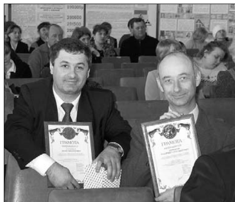
Не было на конкурсе побеждённых: каждый участник награждён памятным дипломом. И это радостно!