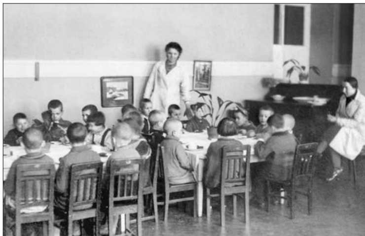
Детский сад на территории ЛГПИ им. Герцена. 19 февраля 1942 г.

В начале войны развернула деятельность лаборатория по изготовлению зажигательных смесей для борьбы с танками про-