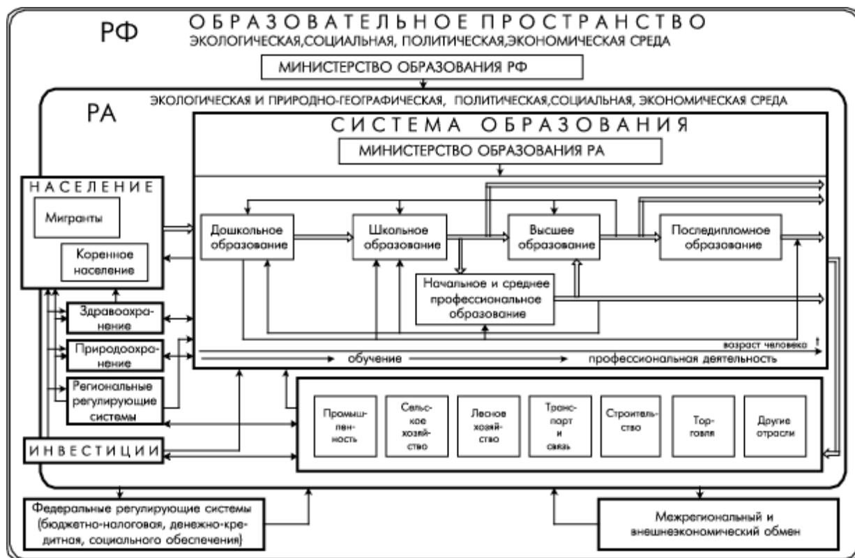
Рис.1. Образовательное пространство системы образования РА.

На рис.1 отображены основные системы, взаимодействующие с системой образования, направление их влияний и обратные связи. Предложенная схема является обобщенным изображением многих возможных направлений исследований в области образования (например, наиболее распространенных исследований эффективности инвестиций в образовании), а также реализацией системного подхода к анализу сложной слабоструктурированной проблемы оценки эффективности образования, в том числе и экономической. Для расчета эффективности инвестиций в образование требуется информация для установления значений различных коэффициентов, определяемых экспертно. Системный взгляд на проблему дает возможность существенно упростить и уточнить определение значений коэффициентов.