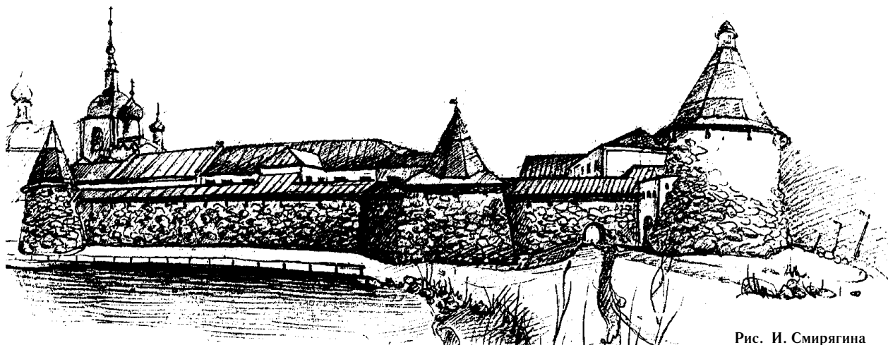
Рис. И. Смирягина

«Природа Соловков, необыкновенный аромат разнотравья, величественные стены монастыря — всё это бесконечно сильно воздействует на человека. Может быть, в этом феномен Соловков. Появляются новые мысли. Открываются глаза на вещи и события, которым раньше не придавал никакого значения. Я хочу сюда возвращаться снова и снова! Я люблю Соловки!»