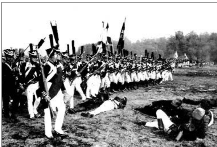
Реконструкция Бородинского сражения. 2002

Военные, как я поняла из выступлений, готовы помочь и помогают органам управления образованием в подготовке молодёжи к военной службе. За последние годы появились десятки суворовских