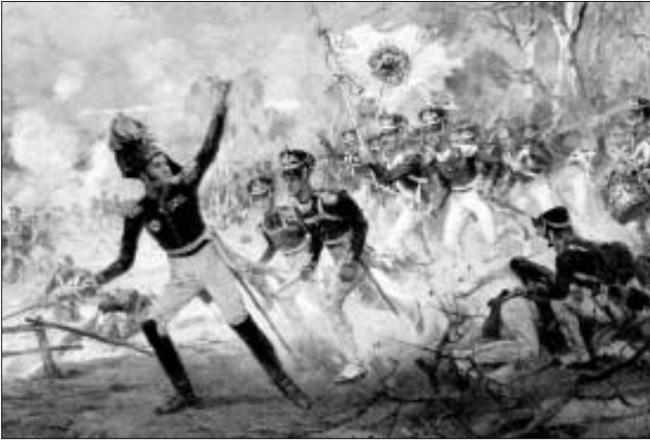
Н. Самокиш. Подвиг солдат Раевского под Салтановкой

является уникальным и старейшим в мире среди музеев, созданных на полях сражений. На площади 109,7 кв. км — около 300 различных памятных объектов, в том числе такие знаменитые, как Шевардинский редут, Багратионовы флеши, Батарея Раевского, командные пункты Кутузова и Наполеона, Спасо-Бородинский монастырь. Есть там также военно-инженерные сооружения Можайской линии обороны 1941 года. Ведь это памятное место двух исторических эпох, свидетельство героизма нескольких поколений россиян! О Бородинском поле слагали поэмы, сочиняли песни, писали картины. Вспомнить хотя бы полотно художника Н. Самокиша «Подвиг солдат Раевского под Салтановкой». Да и как было не восхищаться бесстрашным генералом от кавалерии Николаем Раевским, который в жарком бою с французами 26 августа 1812 года, увидев колебание своих солдат, которые беспорядочно стали отступать, вывел перед строем под картечь двух своих сыновей 15 и 12-ти лет, взял их за руки и смело пошёл вперёд. Воины увидели это, повернули обратно и со своим генералом одержали победу.