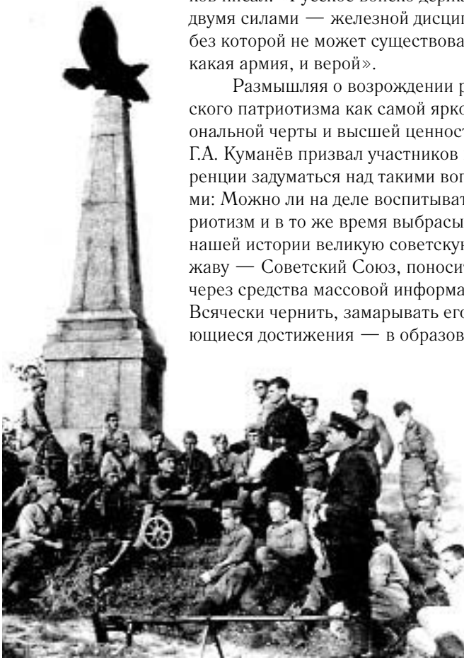
Советские войны у памятника М.И. Голенищеву-Кутузову. 1942

О воспитательной (и антивоспитательной) роли ряда телепередач говорил и выступавший в начале встречи Н.И. Резник. Он указал, что, несмотря на положи-