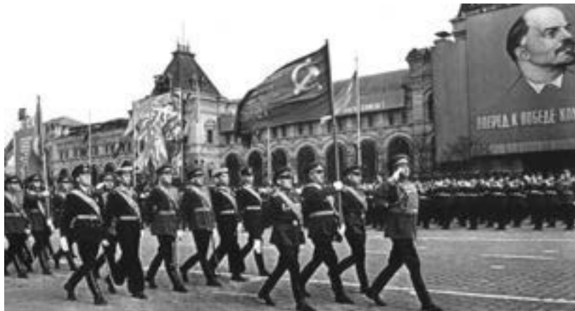
Знамя Победы на Красной площади. 9 мая 1965 года.