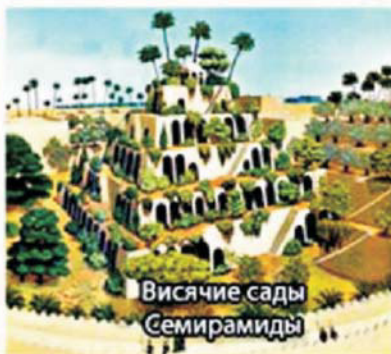
Висячие сады Семирамиды