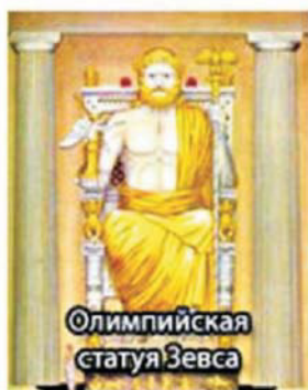
Олимпийская статуя Зевса