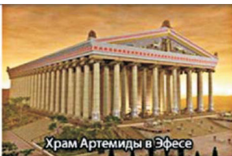
Храм Артемиды в Эфесе