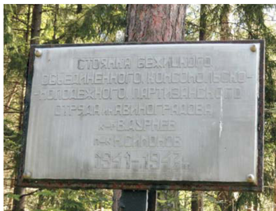
У таблички «Стоянка Бежицкого объединенного молодежно-комсомольского отряда им. А.Виноградова».

быте партизан. Отдельное место занимает рассказ у информационного стенда, где уделено особое внимание гибели командира отряда.