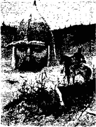
Руслан и голова. Рис. М.С. Нестерова

Пройдут годы, не раз поменяется политическая конъюнктура, но актуальность высокой поэзии на рассеется, и гражданственные эмоции, запечатлённые Пушкиным, будут живым переживанием будущих поколений.