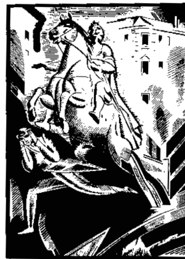
В. Масютин. Илл. к берлинскому изданию «Медного всадника». 1922

«Утаим ли от себя ещё одну блестящую ошибку Петра Великого? Разумею основание новой столицы на северном крае государства, среди зыбей болотных, в местах, осуждённых природою на бесплодие и недостаток. Ещё не имея ни Риги, ни Ревеля, он мог заложить на берегах Невы купеческий город для ввоза и вывоза товаров; но мысль утвердить там пребывание государей была, есть и будет вредною. Сколько людей погибло, сколько миллионов и трудов употреблено для приведения в действие сего намерения? Можно сказать, что Петербург основан на слезах и трупах. Иноземный путешественник, въезжая в государство, ищет столицы, обыкновенно, среди мест плодотворнейших для жизни и здравия; в России он видит прекрасные равнины, обогащённые всеми дарами природы, осенённые липовыми, дубовыми рощами, пресекаемые реками судорожными, коих берега живописны для зрения, и где в климате умеренном благообразный воздух способствует долголетию, — видит и, с сожалением оставляя сии прекрасные страны за собою, въезжает в пески, в болота, в песчаные леса сосновые, где царствуют бедность, уныние, болезни. Там обитают государи российские, с величайшим усилием домогаясь, чтобы их царедворцы и стража не умирали голодом и чтобы ежегодная убыль в жителях наполнялась новыми пришельцами, новыми жертвами преждевременной смерти! Человек не одолеет природы!»