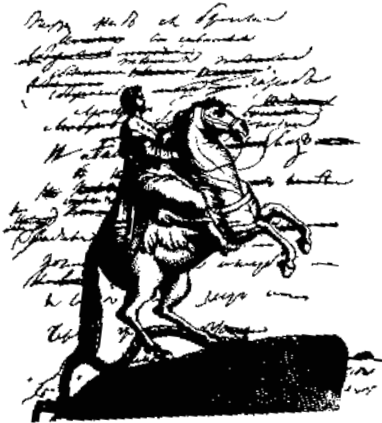
Рисунок А.С. Пушкина

И, обращен к нему спиной, В колеблющей вышине, Над возмущенного Невского Стоит с простертой рукою Кумир на бронзовом коне.