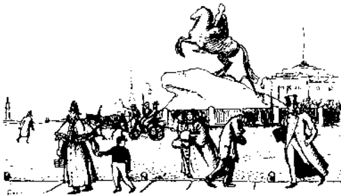
А. Бенуа. Рисунок к «Медному всаднику». 1903

Открывая «Медного всадника», мы читаем стихи, но не просто поэтическую речь, а чеканные, классические строфы, великолепную «державинскую» оду в духе велеречивого XVIII столетия, вдохновенную песнь государственному величию и военной мощи империи, монарху и строителю небывалого столичного града — Петру Великому. Начиная с Ломоносова и его незавершённой поэмы «Пётр Великий», было много од и поэм, где звучали хвалы царю-реформатору и герою Полтавы, но лучшая — это пушкинский «Медный всадник», его знаменитое «Вступление». Восторг проникает в душу и разум поэта и читателя. Здесь всё ликует, даже Нева.