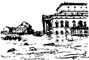
Неопубликованный рисунок А. Бенца. 1903

Здесь, как и в пушкинской трагедии «Борис Годунов», философия русской истории приводит к вещему поэтическому слову, пророчеству и предостережению. Таковы смысл и назначение поэмы «Медный всадник». На вопрос Пушкина Россия отвечала не раз и по-разному. Но всё дело в том, что этот правильно поставленный вопрос великого национального поэта и ныне не потерял своей силы и значимости. Напрасно некоторые наивные люди думают, что Пётр Великий участвует в нашей сегодняшней жизни только в виде безобидного изображения на всем лобезной пятисотрублёвой банкноте. Верный ответ на вопрос Пушкина ещё впереди.